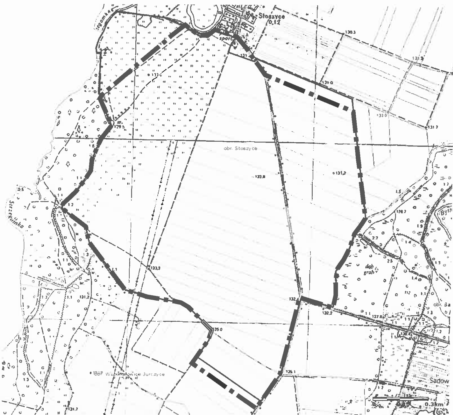
— — — — — | Granice obszarów objętych zmianą studium uwarunkowań i kierunków zagospodarowania przestrzennego