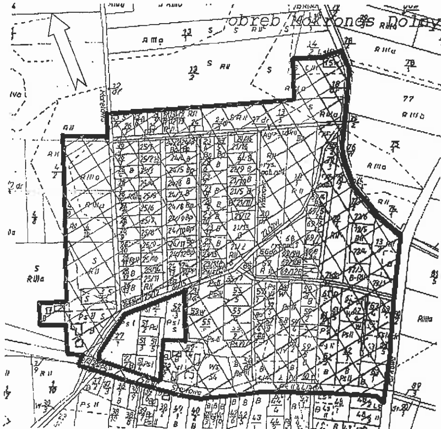
— granica obszaru objętego planem obszar objęty planem