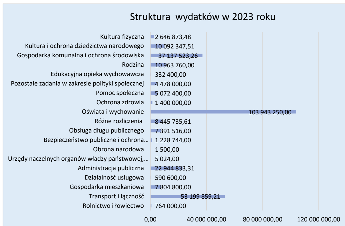
Rys. 1 – Wykres – opracowanie własne

dla niepublicznych żłobków i przedszkoli. Sytuacja ta ma wpływ na budżet Gminy, która jest zmuszona w coraz większym stopniu pokrywać koszty oświaty z własnych środków przy jednoczesnym realizowaniu innych zadań niezbędnych dla zaspakajania potrzeb społeczności lokalnej i realizacji ustawowych zadań.