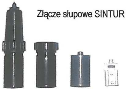
Złącze słupowe SINTUR