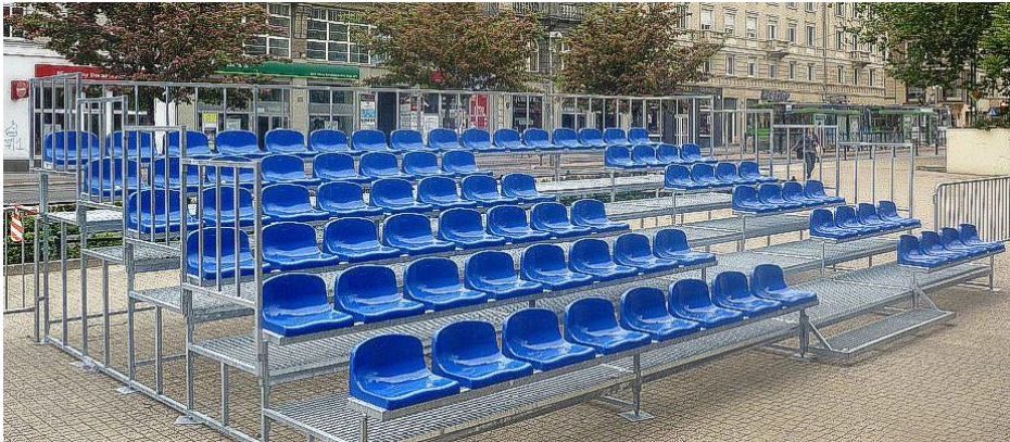
Trybuna prefabrykowana – rysunek poglądowy