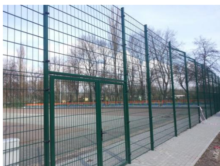
Fot. Zdjęcie poglądowe