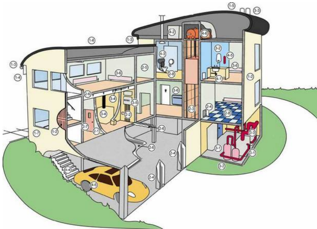
Tabela nr 1 – Zakres zastosowań wyrobów zawierających azbest