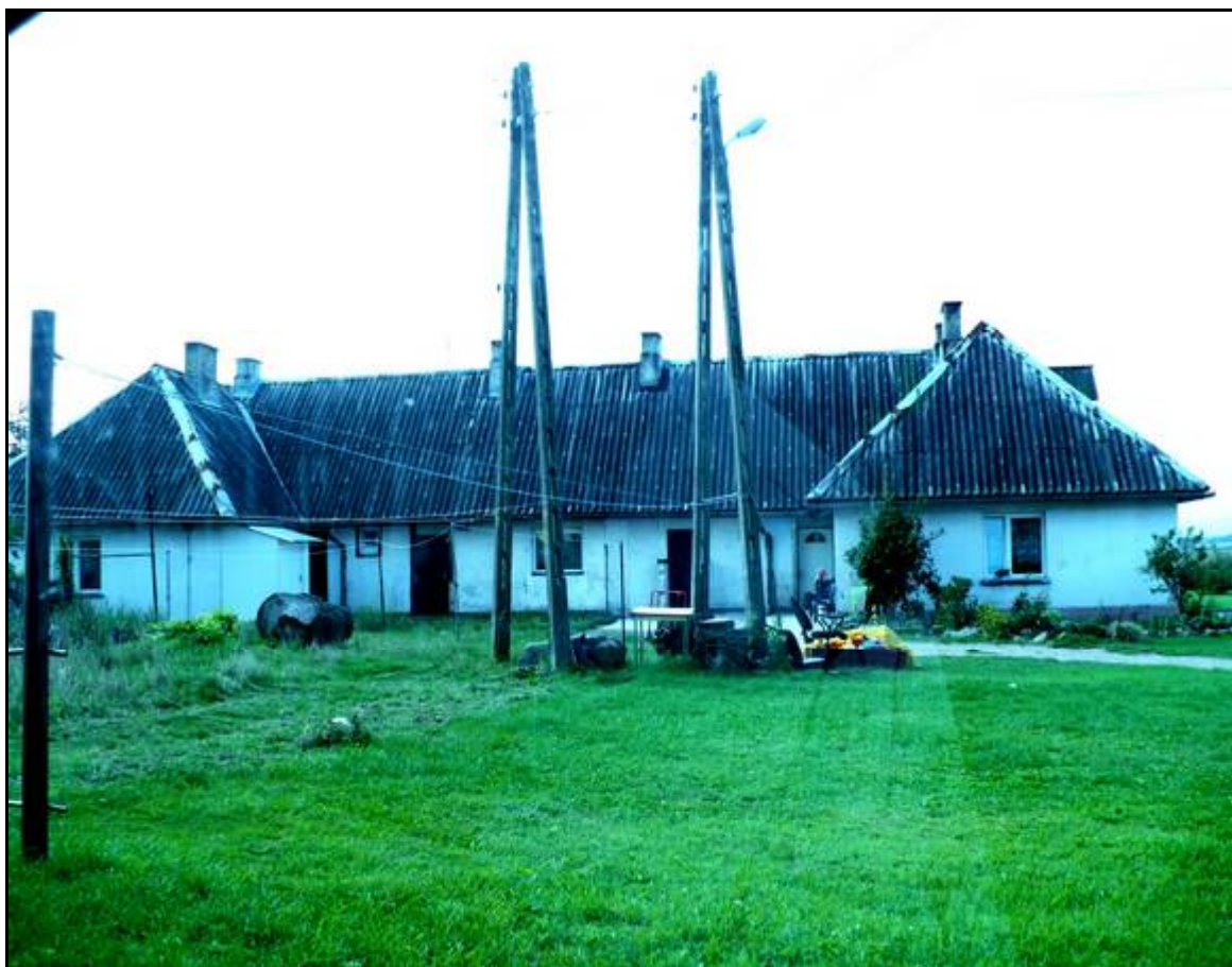
Fot. 7 Budynek mieszkalny we wsi Stary Dwór.