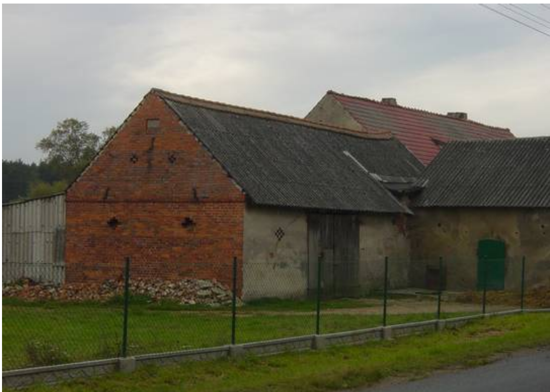
Fot. 3 Różne budynki gospodarcze (obora, stodoła, szopa) pokryte płytami azbestowymi.