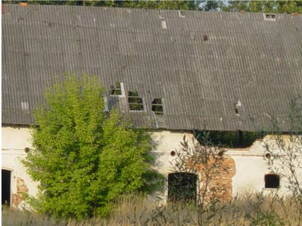
Fot. 2 Przykład budynku gospodarczego z wyraźnie uszkodzonym dachem z płyt azbestowych.

W celu przygotowania do tego obowiązku mieszkańców i instytucji z terenu Gminy Kąty Wrocławskie oraz wyznaczenia określonej strategii działania dla systematycznego, rozłożonego w latach i zgodnego z przepisami prawa procesu usuwania azbestu, został opracowany niniejszy dokument.