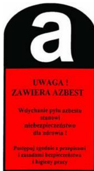
Rys. 2 – Oznaczniki stosowane w miejscach potencjalnej emisji azbestu.

Teren prac należy ogrodzić poprzez oznakowanie taśmami ostrzegawczymi w kolorze biało-czerwonym i umieszczenie tablic ostrzegawczych z napisami „Uwaga! Zagrożenie azbestem!”, „Osobom nieupoważnionym wstęp wzbroniony”.