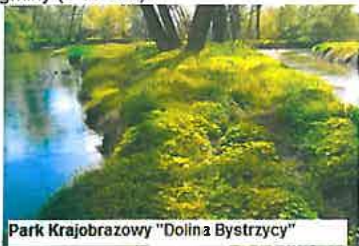
Park Krajobrazowy "Dolina Bystrzycy"

Na terenie Gminy Kąty Wrocławskie zlokalizowana jest część Parku Krajobrazowego „Dolina Bystrzycy”. Znajduje się on w południowej części gminy i stanowi on 23 % ogólnej powierzchni gminy (4 100 ha).