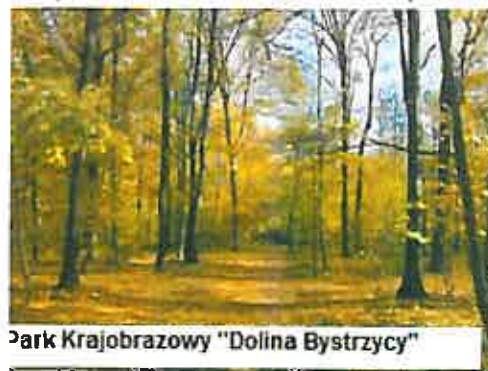
Park Krajobrazowy "Dolina Bystrzycy"

unikatowe grupy fitocenoz leśnych, w tym fitocenozy łęgu wiązowo – jesionowego oraz grądu. Są to lasy występujące na żyznych i podmokłych siedliskach o stosunkowo bogatym runie leśnym. Podstawowymi gatunkami tworzącymi drzewostan lasów jest: grab, jesion, lipa drobnolistna, dąb szypułkowy – są to gatunki rosnące zarówno w grądach, łęgach jak i w zbiorowiskach przejściowych. Nieleśne fragmenty Parku funkcjonują jako pola i łąki, z którymi związane są cenne i chronione gatunki jakimi są: centuria pospolita, ostrożeń siwy, koniopłoch łąkowy. W sumie na terenie parku stwierdzono występowanie 18 gatunków chronionych roślin, wśród których 10 podlega całkowitej ochronie. Fauna parku najliczniej reprezentowana jest przez ptaki. W samym okresie lęgowym odnotowano 118 gatunków, co na ten stosunkowo mały obszar stanowi wysoką liczbę. Dominującymi gatunkami są : modraszka, zięba, bogatka, świstunka, kowalik czy rudzik. Ze względu na niewielkie powierzchnie kompleksów leśnych w Dolinie Bystrzycy ssaków jest stosunkowo mało. Znacznie liczniejsza jest ichtiofauna, reprezentowana przez 17 gatunków ryb. Licznie występują także płazy i gady oraz owady - między innymi chroniony kozioróg dębosz.