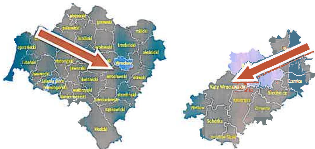
Rys. 1. Położenie Gminy Kąty Wrocławskie na tle podziału administracyjnego województwa dolnośląskiego i powiatu wrocławskiego.