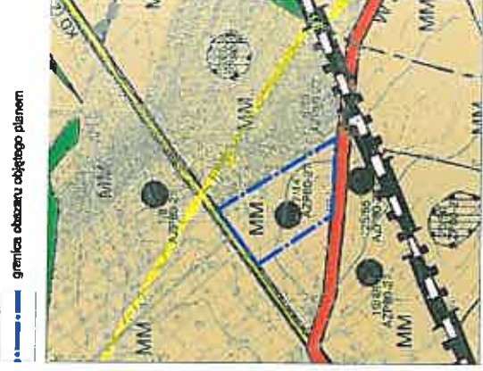
Powiększająca obszar objętego planem: B, 14 ha

Opracowano na podstawie uchwały nr XXVIII/283/12 Rady Miejskiej w Kąkolach Wrocławskich z dnia 28 grudnia 2012 r. w sprawie przystąpienia do sporządzenia zmiany miejscowego planu zagospodarowania przestrzennego wsi Smolec, dla terenów w rejonie ulic Chłopskiej i Wrocławskiej