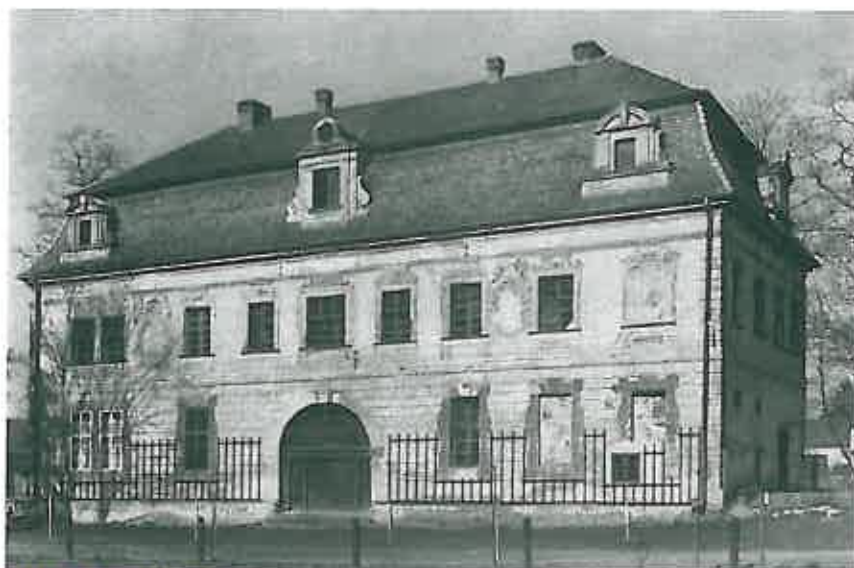
Strona frontowa pałacu - lata 1935-1939