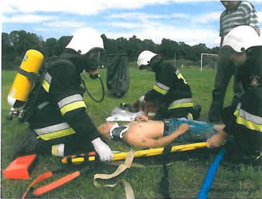
Pokaz udzielania pierwszej pomocy

organizowane są liczne zabawy, konkursy, festyny, a także dożynki. Miejsce to zapewnia mieszkańcom, w tym m.in. dzieciom i młodzieży możliwość aktywnego spędzania czasu wolnego podczas zabaw i gier zespołowych.