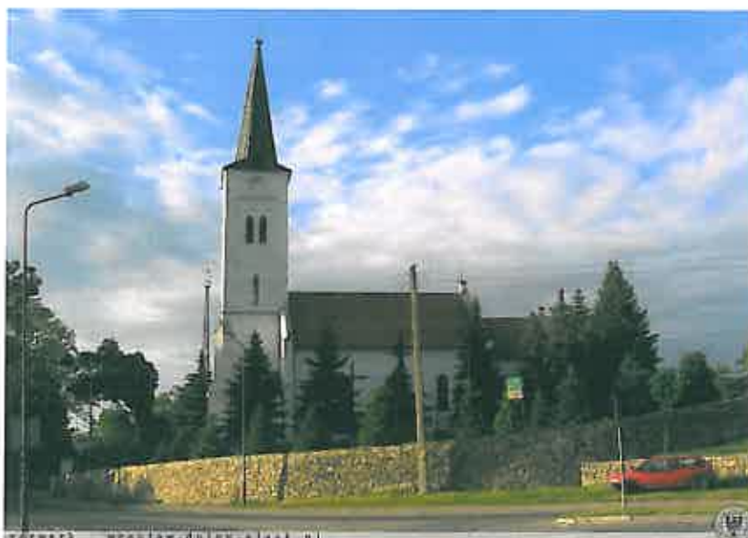
Kościół p.w. św. Filomeny