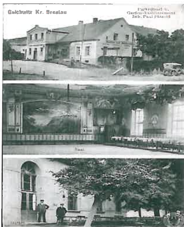
Restauracja Paula Pätzolda. 1915r.

Zarządzali oni Gniechowicami do końca drugiej wojny światowej. Wieś posiadała pod koniec XVIII wieku własny browar, własność rodu Saurma- Jeltsch, gorzelnię, rozwinięte było też rzemiosło, na pewno funkcjonował młyn wodny i dwa wiatraki.