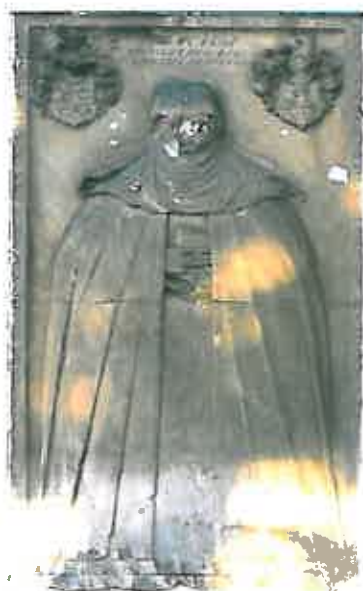
Epitafium na zewnątrz kościoła

Kościół p.w. św. Filomeny został wzniesiony w XV w. w stylu gotyckim, następnie został przebudowany w latach 1853-1854 w stylu neogotyckim. Kościół to budowla orientowana, jednonawowa z węższym kwadratowym prezbiterium i kwadratową neogotycką wieżą. Neogotyckie portale z barokowymi drewnianymi okutymi drzwiami, zachodni i południowy, wykonane są z piaskowca.