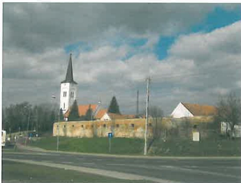
Widok na Kościół i mur przykościelny

budynków, mieszkalnych i innych, jest ul. Kątecka. Przy ul. Kąteckiej znajdują się również zabudowania kościelne (kościół p.w. Św. Filomeny, który jest obecnie jedynym kościołem we wsi oraz murowany budynek plebanii), a także dwa ośrodki zdrowia wraz z filią urzędu pocztowego.