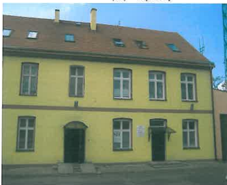
Ośrodek zdrowia przy ul. Kąteckiej 49

Ośrodek zdrowia przy ul. Kąteckiej 49 i ul. Kąteckiej 50 zapewnia mieszkańcom Gniechowic opiekę medyczną, w tym leczenie ambulatoryjne. W budynku znajdują się ponadto prywatne gabinety lekarskie. W drugim ośrodku zdrowia zlokalizowany jest m.in. gabinet dentystyczny oraz lekarz rodzinny.