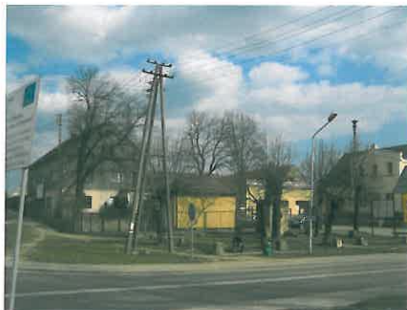
Skwer przy skrzyżowaniu ul. Wrocławskiej i Kąteckiej