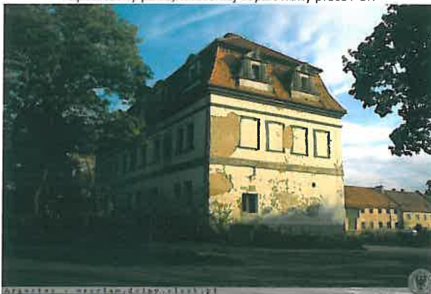
Opuszczony pałac, wcześniej użytkowany przez PGR

Obecnie pałac znajduje się w rękach prywatnych, w stanie ruiny. W wyniku prac rewitalizacyjnych powstało nowe pokrycie dachowe i zrekonstruowano lukarny, prace objęły m.in. budowę nowej więźby dachowej, montaż dachówki, montaż stropów, nową instalację wentylacyjną, przemurówki ścian wewnętrznych oraz montaż ściągów w celu wzmocnienia konstrukcji budynku. Powierzchnia użytkowa obiektu wynosi ok. 1000 m 2 , w przyszłości pałac można przystosować do pełnienia funkcji hotelu, zajazdu lub restauracji.