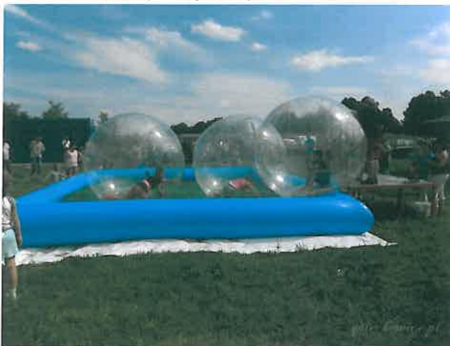
Zabawy dla najmłodszych mieszkańców