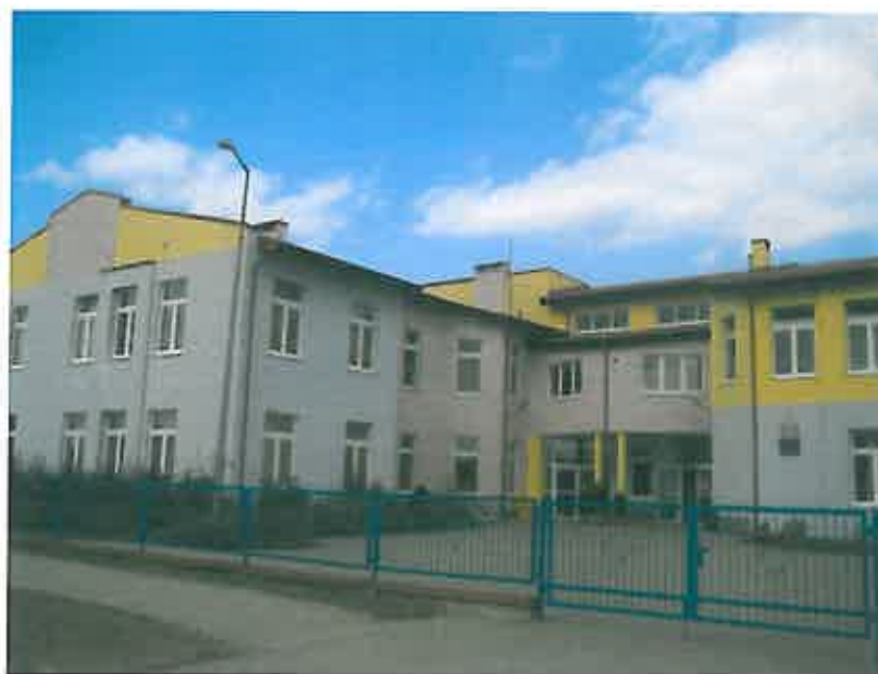
Budynek Szkoły Podstawowej