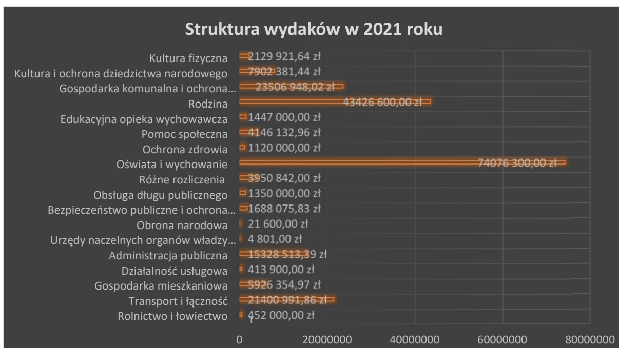
Rys. 1 – Wykres – opracowanie własne

limitem w WPF, dofinansowywane ze środków UE i innych środków zewnętrznych oraz poprawiające bezpieczeństwo obywateli, rozwój infrastruktury oświatowej, kanalizacyjnej i ochronę środowiska. Najwięcej zaangażowania środków finansowych wymaga oświata zarówno na zadania bieżące jak i inwestycyjne. Subwencja oświatowa ustalona na rok 2021 wynosi 25.819.761 zł. Przy konstruowaniu projektu budżetu kierowano się również prognozami ustalonymi przez budżet państwa oraz wskaźnikami dotyczącymi cen materiałów, paliw, energii i podatków oraz projektowanych przez Radę Polityki Pieniężnej wzrostem stóp procentowych od 2021 roku. Ministerstwo finansów podało wzrost maksymalnych, dopuszczalnych stawek podatków i opłat lokalnych średnio o 3,9 %. Stawki te zostały zwaloryzowane o wskaźnik cen i towarów za I półrocze 2020 roku. Rosną koszty dotacji dla niepublicznych żłobków i przedszkoli. Dotacje na realizację zadań przedszkolnych wynoszą jedynie 2 443 956 zł. Sytuacje te mają wpływ na budżet Gminy, która jest zmuszona sięgać po zwrotne instrumenty finansowe tj. obligacje aby realizować zadania, które są niezbędne dla zaspakajania potrzeb społeczności lokalnej oraz realizacji ustawowych zadań.