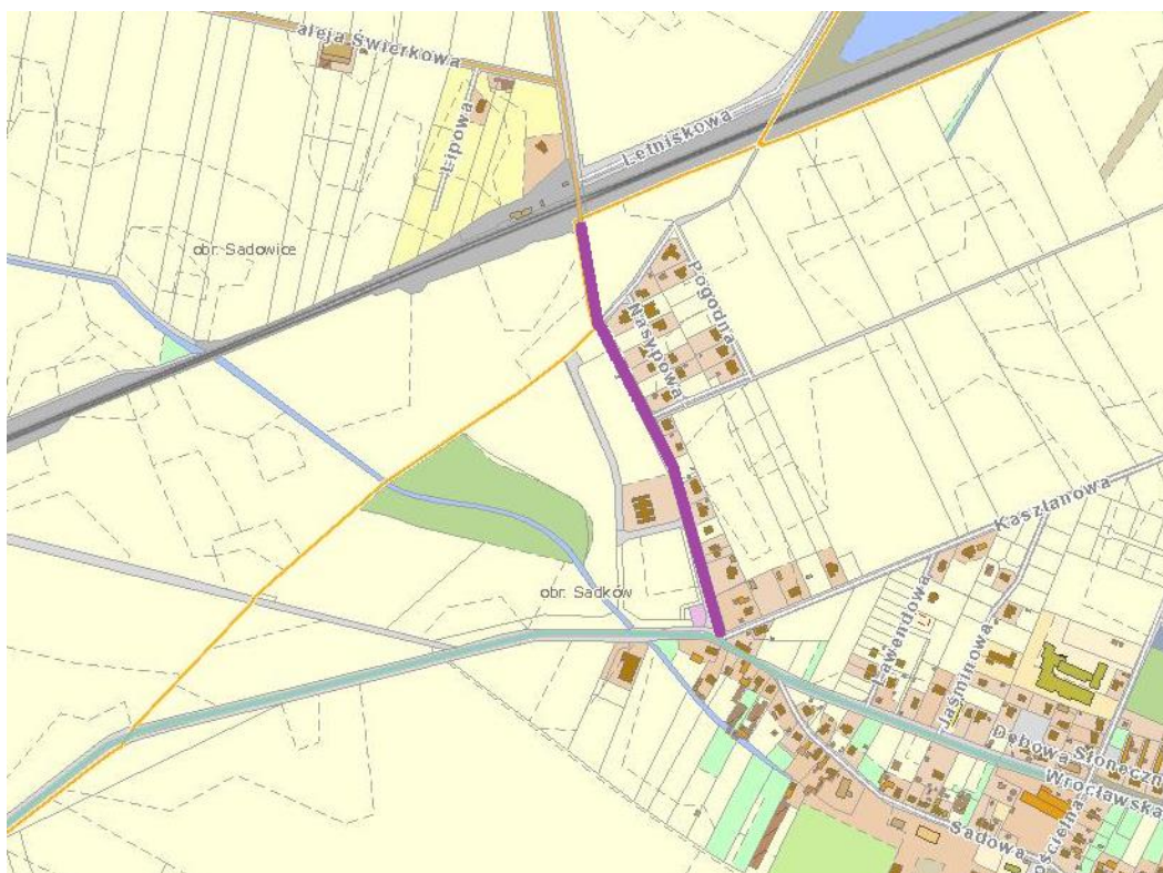
Droga Powiatowa nr 2018D Sądaków