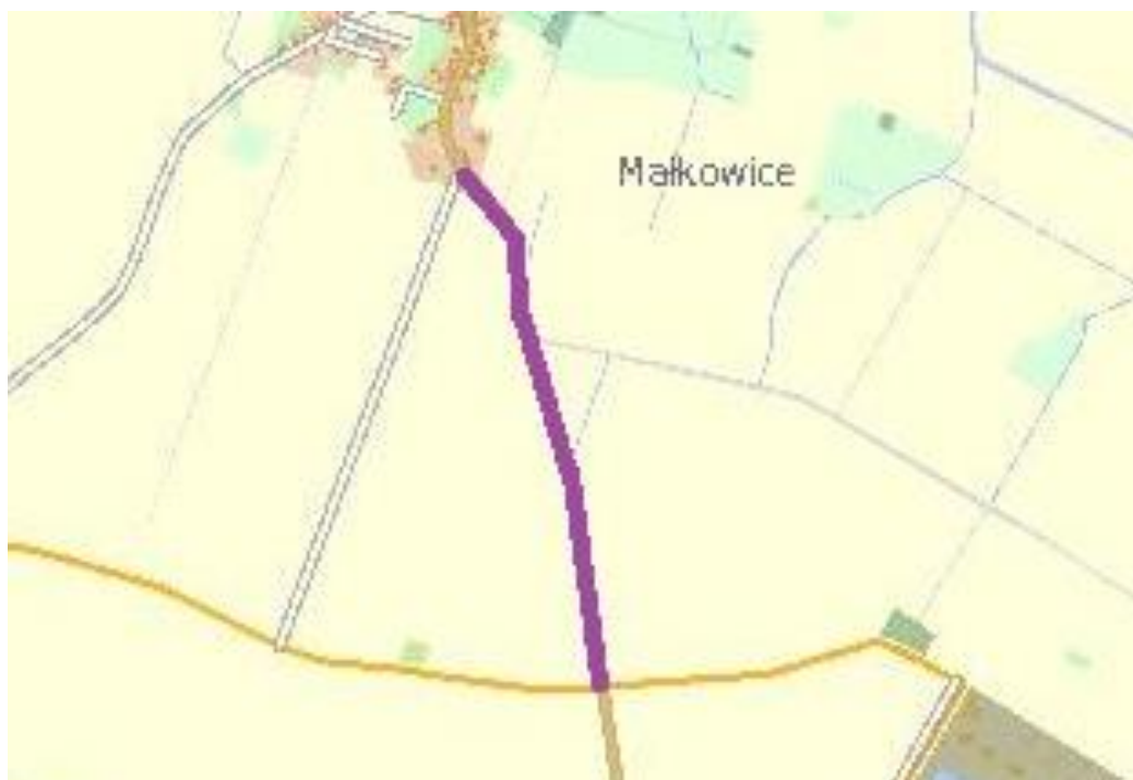
Droga Powiatowa nr 2018D Malkowice – Sadków/Sadowice